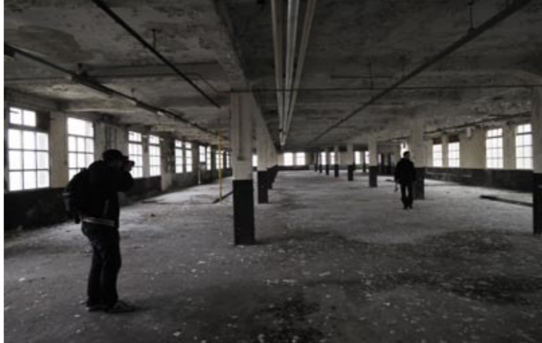
Op onderzoek in de verlaten Koninklijke Verenigde Lederfabriek in Oisterwijk.