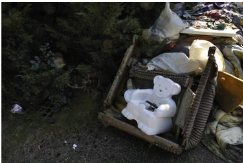
Een enkel voorwerp herinnert nog aan de oorspronkelijke bestemming van het gebouw, zoals hier in het weeshuis in As.