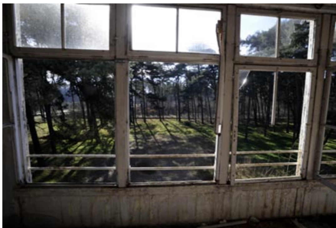
Het weeshuis in As. Urbex'ers nemen zekere risico's. Vloeren en trappen kunnen vermolmd zijn.