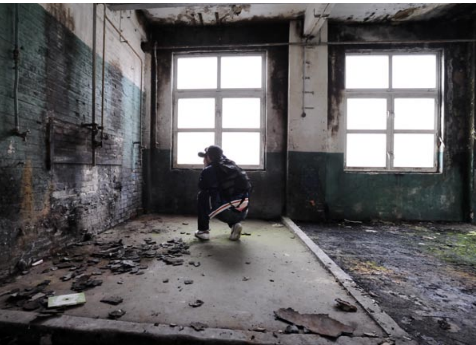
Het desolate interieur van de Oisterwijkse leerfabriek.